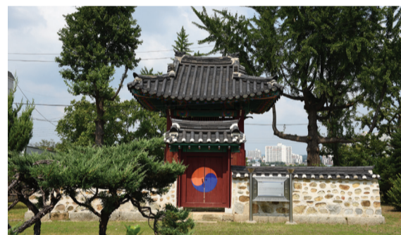
▲ 대로사 비각

조선 숙종 때의 대학자이자 정치가인 우암(尤庵) 송시열(宋時烈, 1607~1689)을 제향(祭享)하기 위해 1785년(정조 9) 경기도 여주(驪州) 강변에 지은 대로사(大老祠)의 내력을 기록한 비이다. ‘대로(大老)’란 정조가 지어준 송시열의 존칭이다.