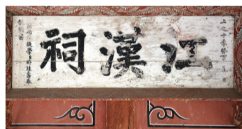
▲ 강한사 편액