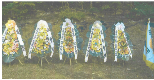
▲ 도봉서원 추향제