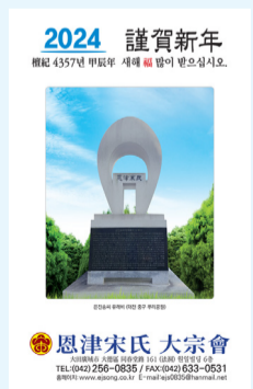
2024 謹賀新年 恩津宋氏 大宗會

달력은 각 파종중과 지역 종친회에 5개~20개씩을 배부하였으며, 임원(고문, 상무유사, 각위원회(포상심사, 장학, 문화행사, 종보편집 위원), 파유사 및 집행부, 종중건물 입주업체, 고액 헌성금 기부자 등에게 개별 배부완료하였다.