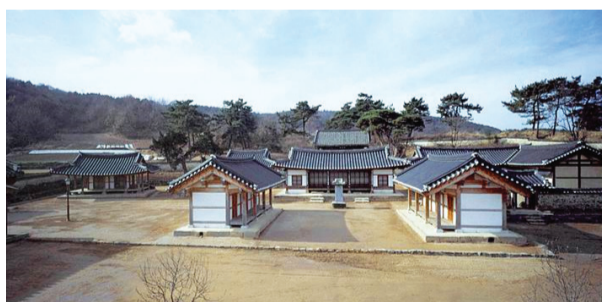
▲ 돈암서원 전경 (사적 제383호)

서원의 발의가 나온 것은 사계 김장생 타계 직후 여러 유사(有司)가 주도하고 충청지방 각 지역 사족들인 현직 관료 6명, 전직 관원 9명, 유학 4명, 생원 4명들이 호응하여 이들이 서원 창건의