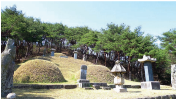
▲ 양근공 여림과 배위 광산김씨 묘역 (대전 동구 이사동)

대대로 번성하여 지금은 은진송씨 39개 파의 절반에 가까운 18개 파를 차지하고 있다. 그 아홉 아들