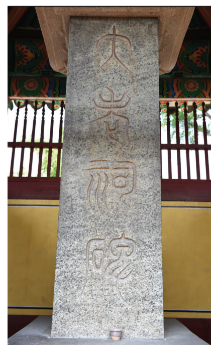
▲ 대로사 비

의 주칠(朱漆)을 한 흔적이 남아 있다. 사각형 받침돌에 비신을 세우고 지붕돌을 얹은 방부개석(方趺蓋石) 양식을 갖추고 있다.