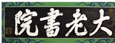
▲ 대로서원 편액