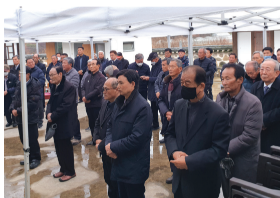
▲ 목사공 세일사

이어 목사공종중 세일사에 12년(2011~2022) 동안 한번도 빠짐없이 참여 하신 10여분의 종원님께 감사함의 표시로 조그마한 선물(고급