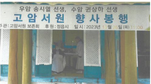
▲ 고암서원 향사봉행