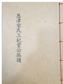
▲ 삼기당공파 족보