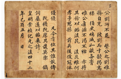
▲ 송준길 서첩

동춘당은 우암(尤庵) 송시열(宋時烈 1607~1689)과 함께 울곡(栗谷) 이이(李珣 1536~1584) 아래 사계(沙溪) 김장생(金長生 1548~1631)과 신독재(慎獨齋) 김집(金集 1574~1656)의 학통을 계승하여 평생 동안 학문과 정치적 입장을 같이 했다. 서풍에