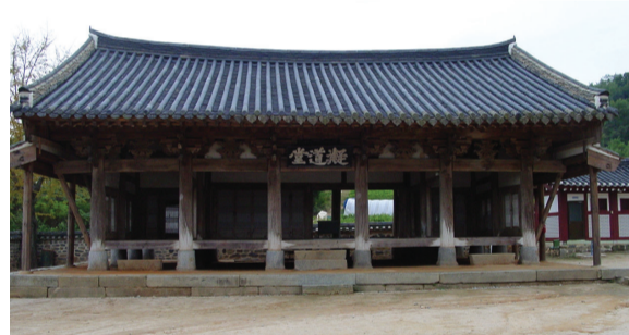
▲ 응도당 (보물 제1569호)

1689년(숙종15) 기사환국으로 서인이 축출되고 남인이 재집권하면서 유배와 사약을 받은 이후 송시열의 행적에 대하여는 당파간의 칭송과 비방이 무성하였다. 그러나 1716(숙종42) 병신처분과 1756년(영조32)의 문묘 배향으로 그의 학문적 권위와 정치적 정당성은 공인되었고 영조 및 정조 대에 노론의 일당전체가 이루어 지면서 그의 역사적 지위는 더욱 견고하게 확립 되고 존중되었다.