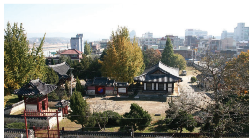
▲ 강한사 전경

이후에 정조가 영릉에 행차하다가, 이 이야기를 듣고 김양행(金亮行)에게 송시열의 사당을 짓게 하였고, 송시열을 높여 ‘대로(大老)’의 명칭을 붙여 사당을 ‘대로사(大老祠)’라 하였다.