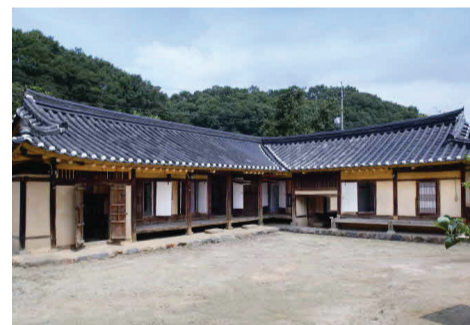
▲ 안채 및 사랑채

는 형상으로 배치되어 있다. 꽤 고전적인 맛을 풍기는 건물이지만 보존상태가 양호하지 않아 관리가 필요하다.