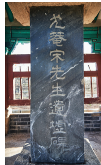
▲ 우암송선생 유허비

유허비란 한 인물의 행적을 기리고, 그의 옛 자취를 밝혀 후세에 알리고자 세워두는 비로, 이 비는 조선 후기의 문신인 송시열 선생을 기리고 있다. 우암 송시열(1607~1689) 선생은 조선의 대 유학자로, 그의 유학 사상은 이 울곡의 학통을 계승하여 기호학파의