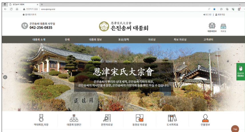
▲ 홈페이지 대문

“이제까지 봐왔던 일반 문중 홈페이지와 격이 다르다. 문중 홈페이지로서는 획기적으로 변화된 모습을 보였다. 구축하느라 고생 많이 한 흔적이 엿보이고 타 문중의 홈페이지와는 180도 다른 상상 이상의 편집을 했다. 전체적으로 훌륭하다. 욕심을 부리자면 자료들에 원문과 원자료들까지 같이 올렸으면 좋겠다. 홈페이지의 목적은 많은 사람들에게 은진송씨에 대하여 정확히 알리는 데 목적이 있는 것으로, 수시로 교정도 해야 한다. 은진송씨가 아닌 연구자나 일반인들도 정보를 볼 수 있도록 제공해야 하는데 링크가 너무 많이 걸려있다. 연구자로서 볼 때 가능하면 링크를 풀었으면 하는 바람이다. 파시조 급 위의 인물들에 대한 묘갈문 등 원문 제공은 잘 되었다. 자료의 원전 소개 등 원문 서비스 등을 보완하면 그야말로 아카이브로의 변화라 할 수 있다.”