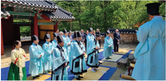
▲ 송시열선생 탄생기념 춘향제

우암 송시열선생은 효종, 현종, 숙종의 스승으로 문묘에 배향되었으며 효종 대왕 묘정에도 위패가 배향되어 있다.