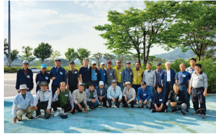
▲ 판서공증증 단합대회 후 기념촬영

이날 참석한 모든 증원들은 피곤함도 잊은 채 돌아오는 버스안에서 미리 준비한 싱싱한 회를 안주로 소주잔을 나누며 짧은 여행 일정이 아쉽기만 하였고 모두가 건강한 모습으로 내년의 판서공증증 단합대회에 다시 만나기를 기약하며 이날의 일정을 모두 마쳤다.