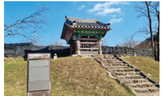
▲ 우암 송선생 유허비각

주류를 이루었다. 조선 인조 대부터 숙종 대에 이르는 4대에 걸친 노론의 대표로서 정계에서 크게 활약하였으며 뛰어난 학식으로 많은 학자를 길러내었다.