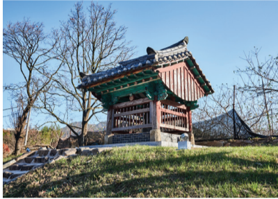
▲ 영동 송시열 유허비 전경

유허비란 한 인물의 행적을 기리고, 그의 옛 자취를 밝혀 후세에 알리고자 세워두는 비로, 이 비는 조선 후기의 문신인 송시열 선생을 기리고 있다. 우암 송시열(1607~1689) 선생은 조선의 대 유학자로, 그의 유학 사상은 이 울곡의 학통을 계승하여 기호학파의