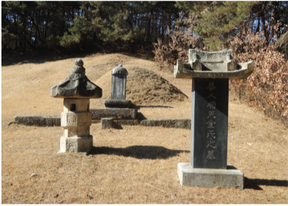
▲ 지평공 배위 순천김씨 묘역과 묘비 (대전 동구 주산동)

공인(恭人) 순천김씨(順天金氏)는 쌍청당의 큰아들 지평공(持平公 : 繼祀) 선조님의 배(配)이자, 류조비(柳祖妣)의 손자며느리이다. 판전농사(判典農寺事) 김종흥(金宗興)의 따님으로 1407년(태종 7)에 한양에서 태어났는데 절재(節齋) 김종서(金宗瑞) 장군은 바로 공인 김씨의 큰아버지가 되신다. 대대로 높은 벼슬을 지낸 이름 있는 집안에서 태어난 공인 김씨는 어려서부터 현숙한 자태에 덕망이 있었는데